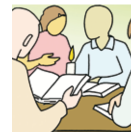
(Mt 5, 1)

Matthieu s'adresse à la communauté après la destruction du Temple et l'exclusion des chrétiens du judaïsme. Ces chrétiens devaient-ils encore payer l'impôt religieux, comme les autres Juifs ? La première réponse de Jésus est «de principe» : comme fils (Jésus et les disciples comme fils de Dieu), il n'y a pas à payer pour le Temple de Dieu. La deuxième réponse est pratique : «Pour éviter de faire du scandale auprès de ces gens-là, paie la part réclamée !» (Remarque : chute et scandale sont le même mot en grec.)